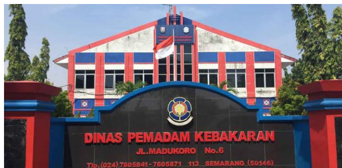
Gambar 2.2 Kantor Dinas Pemadam Kebakaran Kota Semarang