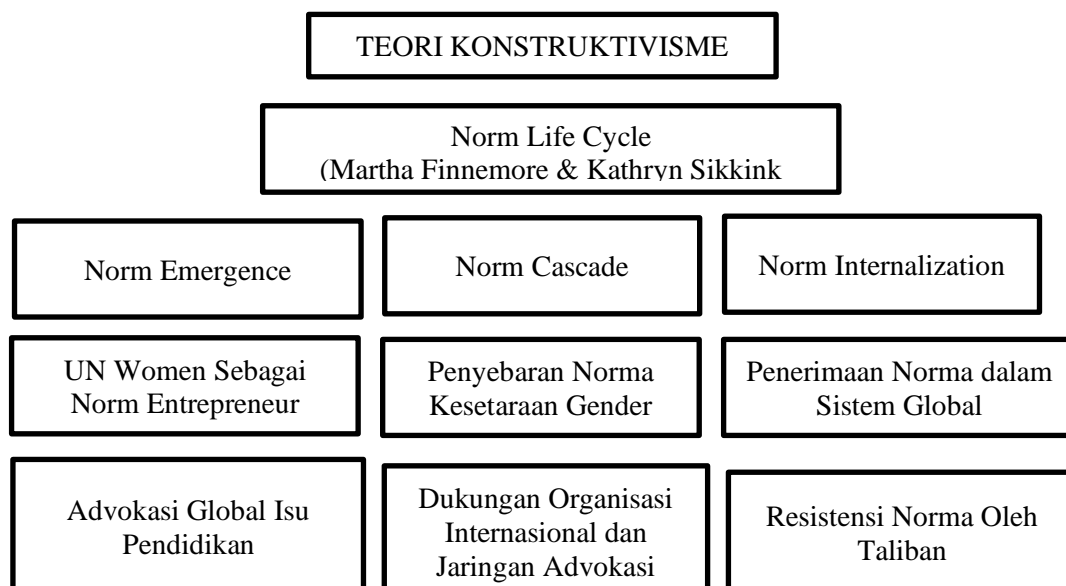
Tabel 1. 2 Skema Pemikiran