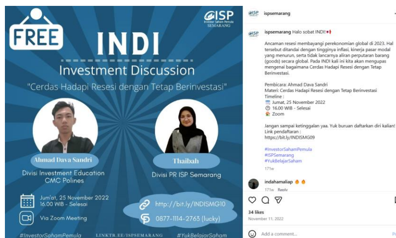
Gambar 2. 3 Informasi Investment Discussion

strategi investasi jangka pendek dan jangka panjang. Webinar dan seminar ini menghadirkan narasumber yang berasal dari praktisi pasar modal, akademisi, maupun pelaku industri keuangan, sehingga peserta memperoleh pemahaman yang komprehensif dan aplikatif.