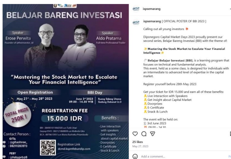
Gambar 2. 2 Informasi webinar “Mastering the Stock Market to Escalate Your Financial Intelligence)

Komunitas Investor Saham Pemula (ISP) Semarang secara aktif menyelenggarakan berbagai program edukasi dan kegiatan komunitas yang bertujuan untuk meningkatkan literasi dan inklusi keuangan masyarakat, khususnya dalam bidang pasar modal. Aktivitas yang dilakukan oleh ISP Semarang mencakup kegiatan edukatif, diskusi komunitas, serta program pengembangan kapasitas anggota. Melalui berbagai kegiatan tersebut, komunitas ini berperan sebagai wadah pembelajaran informal bagi investor pemula, mahasiswa, dan masyarakat umum yang tertarik pada investasi saham.