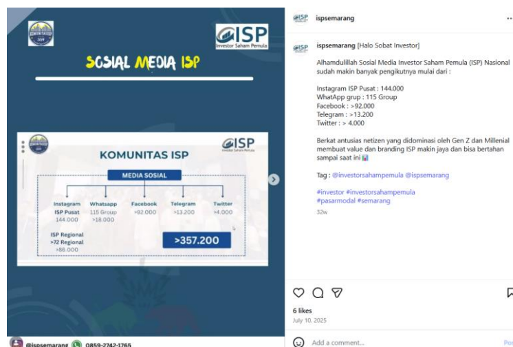
Gambar 2. 4 Sosial Media Komunitas ISP