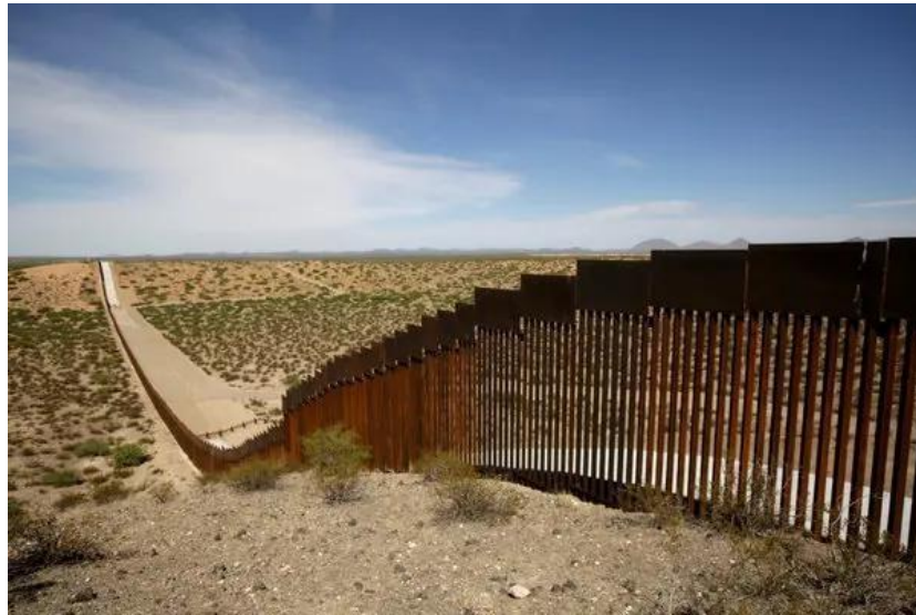
Gambar 2.2 Trump Wall

tekad untuk mengambil langkah keras dalam menjaga kedaulatan wilayah AS. Proyek ini juga diperkenalkan sebagai cara untuk mengembalikan kontrol penuh atas perbatasan selatan yang menurut Trump telah lama dianggap lemah (Trump White House, 2020).