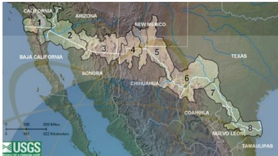
Gambar 2.1 Negara di sekitar perbatasan AS-Meksiko