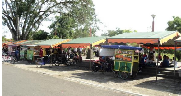
Gambar 1.1 Kondisi Sebelum Relokasi.