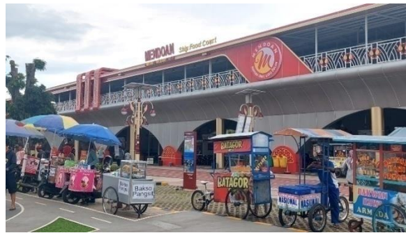
Gambar 1.2 Alun-alun Kebumen Setelah Relokasi.

Mereka berjualan dengan memanfaatkan taman-taman kota, di trotoar bahkan di bahu jalan. Pemandangan ini hampir ditemui di sepanjang jalan kabupaten, seperti Jalan Pahlawan, Jalan Soekarno Hatta, Jalan Merdeka hingga Jalan Veteran. Untuk membuat tatanan pedagang kaki lima menjadi rapi pemerintah daerah membuat sebuah pusat kuliner yang didalamnya menampung para pedagang kaki lima.