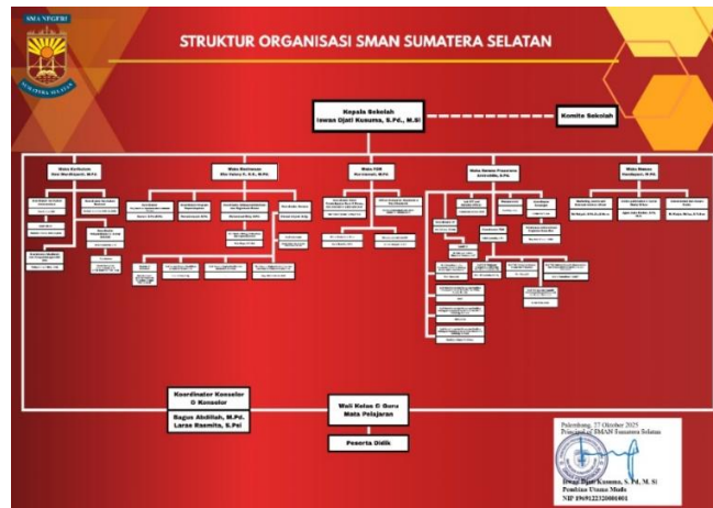
Gambar 2. 2 Struktur Organisasi SMA Negeri Sumatera Selatan