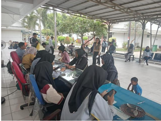
Gambar 2. 2 Meja Pelayanan Bidang Penempatan & Perluasan Kesempatan Kerja di Disnakertrans Kabupaten Karawang

bidang ketenagakerjaan dan transmigrasi, serta menjalankan tugas pembantuan.