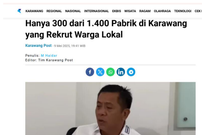
Gambar 1. 3 Berita laporan perusahaan di Karawang dalam perekrutan pekerja lokal

Peraturan Bupati Kabupaten Karawang No 8 Tahun 2016 juga terdapat kebijakan seleksi pekerja /buruh dengan 1 (satu) pintu pada Dinas Tenaga Kerja dan Transmigrasi Kabupaten Karawang. Seleksi tenaga kerja dilakukan melalui satu pintu, yaitu Disnakertrans. Hal ini bertujuan untuk mencegah intervensi dan praktik tidak etis dalam proses rekrutmen. Disnakertrans memiliki tanggung jawab untuk mengawasi pelaksanaan rekrutmen dan memastikan bahwa perusahaan mematuhi peraturan ini.