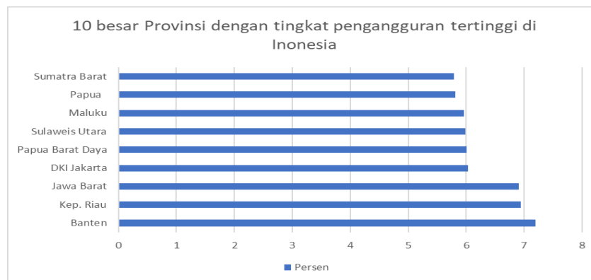
Gambar 1. 2 Provinsi dengan tingkat pengangguran tertinggi di Indonesia

pengangguran hanya berada pada kisaran 3,6%–4,3% pada tahun 2024. Kegagalan untuk mencapai target ini memperkuat argumen bahwa kebijakan ketenagakerjaan belum sepenuhnya berhasil mengatasi tantangan struktural yang dihadapi pasar kerja Indonesia.