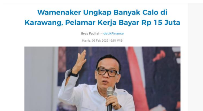
Gambar 1.4 Berita dugaan calo tenaga kerja di Kabupaten Karawang

Karena itu, keberadaan data perusahaan yang tercatat secara resmi di Disnakertrans sangat krusial untuk memantau implementasi kebijakan dan memastikan kesempatan kerja diperluas bagi warga Karawang. Namun realitas menunjukkan bahwa sistem pelaporan, pemantauan, dan penegakan partisipasi perusahaan masih lemah sehingga target kebijakan belum tercapai secara optimal. Hal ini menegaskan perlunya perbaikan mekanisme pemantauan, insentif atau sanksi bagi perusahaan, serta peningkatan transparansi dan kemudahan akses informasi lowongan agar Perbup No 8 Tahun 2016 dapat benar-benar berdampak bagi tenaga kerja lokal.