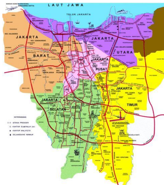
Gambar 2. 1 Peta Wilayah Administrasi DKI Jakarta

Daerah Khusus Jakarta secara astronomis terletak di antara 5^{\circ}10'00'' hingga 6^{\circ}23'54'' LS dan 106^{\circ}19'30'' hingga 106^{\circ}58'18'' BT. Jakarta berada di dataran rendah dengan ketinggian rata-rata 7 m di atas permukaan laut di mana sekitar 40% luas wilayahnya terletak pada ketinggian 1-1,5 m di bawah permukaan laut, terletak di muara daerah aliran sungai dan dilintasi oleh 13 sungai. Wilayah Jakarta berbatasan langsung dengan Laut Jawa dan Kabupaten Tangerang Provinsi Banten di sebelah utara; Kabupaten Bekasi dan Kota Bekasi Provinsi Jawa Barat di sebelah timur; Kota Depok Provinsi Jawa Barat di sebelah Selatan; dan Kota Tangerang dan Kota Tangerang Selatan Provinsi Banten di sebelah barat. Lokasi geografis yang strategis menjadi faktor pendorong pembangunan wilayah sekitarnya, begitu pun sebaliknya, pembangunan Jakarta turut dipengaruhi oleh perkembangan di kota sekitarnya.