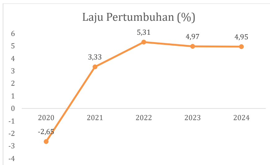
Gambar 2.1 Laju Pertumbuhan Ekonomi Provinsi Jawa Tengah Tahun 2024