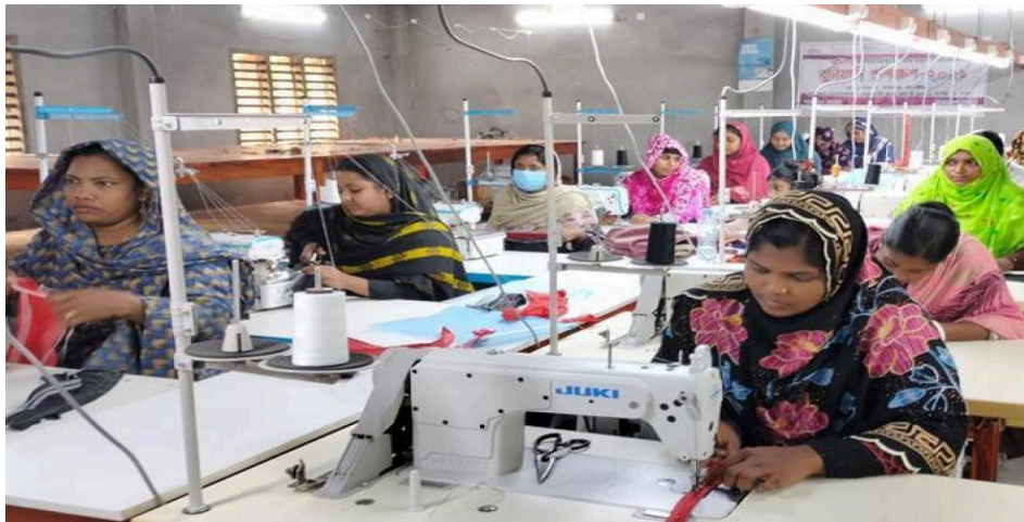
Gambar 2.2 Proyek Pemberdayaan Wanita untuk Pertumbuhan Inklusif (WING)

Pembangunan Lima Tahun Kedelapan (8th Five Year Plan) Pemerintah Bangladesh. Keselarasan ini memastikan bahwa berbagai program UN Women termasuk EmPower memiliki legitimasi kelembagaan serta dukungan politik yang jelas dari tingkat pusat hingga daerah (United Nations Bangladesh, 2021). Dalam hal ini, UN Women berperan sebagai mitra teknis yang menyediakan keahlian dalam integrasi perspektif gender ke dalam kebijakan dan program pembangunan lintas sektor.