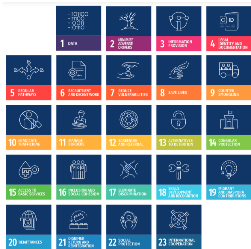
Gambar 2.23 Objectives dalam Global Compact for Safe, Orderly, and Regular Migration (GCM)