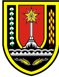
Gambar 2. 1 Logo Kota Semarang