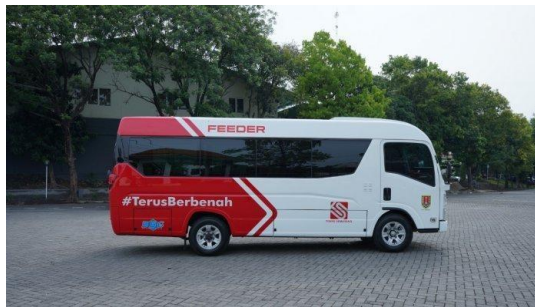
Gambar 2. 4 Feeder Trans Semarang

Feeder Trans Semarang merupakan suatu layanan transportasi umum yang berbentuk minibus ELF untuk menjangkau ke area yang berfungsi untuk menjangkau wilayah yang tidak dilalui oleh jalur utama BRT Trans Semarang dengan kapasitas 22 orang. Layanan ini diluncurkan pada Desember 2019 sebagai alternatif yang diinisiasikan oleh Pemkot Semarang untuk memudahkan masyarakat dalam melakukan mobilisasi khususnya bagi masyarakat yang tinggal di area yang belum terlayani oleh BRT Trans Semarang.