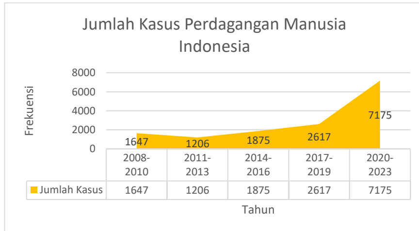
Gambar 1. 1 Jumlah Kasus Perdagangan Manusia Indonesia

peningkatan jumlah kasus perdagangan manusia di Indonesia selama beberapa tahun terakhir: