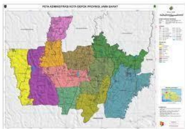
Gambar 2. 1 Peta Administrasi Kota Depok Provinsi Jawa Barat

Berdasarkan data Badan Pusat Statistik (BPS) Kota Depok tahun 2024, jumlah penduduk Kota Depok mencapai 2.163.635 jiwa dengan luas wilayah sekitar 200,29 km 2 , sehingga tingkat kepadatan penduduk mencapai 10.800 jiwa per km 2 . Angka ini menempatkan Depok sebagai salah satu kota dengan kepadatan penduduk tertinggi di wilayah penyangga Jakarta (Jabodetabek) setelah Kota Bekasi. Pertumbuhan penduduk yang tinggi di Kota Depok didorong oleh meningkatnya arus urbanisasi akibat posisinya yang strategis sebagai kota penyangga antara Jakarta dan Bogor. Hal ini menyebabkan peningkatan permintaan terhadap hunian, transportasi, dan fasilitas publik termasuk jalur pedestrian yang memadai.