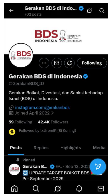
Gambar 2. 6. Akun X Gerakan BDS Indonesia (@GerakanBDS_ID)