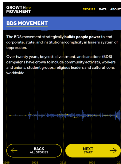
Gambar 2. 4. Tampilan https://bds.visualizingpalestine.org/ sebagai website yang memberikan informasi terkait perkembangan gerakan BDS secara global