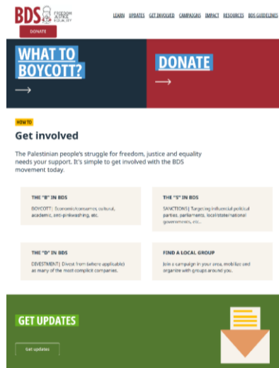
Gambar 2. 3. Tampilan website Gerakan BDS