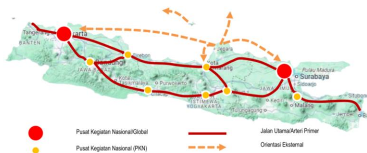
Gambar 2.1 Peta Batas Wilayah Jepara

Secara geografis, Kabupaten Jepara terletak pada 110^{\circ} 9' 48,02'' hingga 110^{\circ} 58' 37,40'' Bujur Timur dan 5^{\circ} 43' 20,67'' hingga 6^{\circ} 47' 25,83'' Lintang Selatan. Dengan posisi tersebut, Kabupaten Jepara merupakan wilayah paling utara di Provinsi Jawa Tengah dan berbatasan langsung dengan Laut Jawa. Luas wilayah daratan Kabupaten Jepara mencapai 1.004,132 \text{ km}^2 , sedangkan luas lautannya sebesar 1.845,6 \text{ km}^2 , dengan panjang garis pantai sekitar 82 km. Kabupaten Jepara juga memiliki wilayah kepulauan di Laut Jawa, yaitu Kepulauan Karimunjawa, yang merupakan salah satu wilayah administratif kecamatan. Kepulauan Karimunjawa terdiri atas 27 pulau, dengan 5 pulau berpenghuni dan 22 pulau tidak berpenghuni. Pulau Karimunjawa dan Pulau Kemujan merupakan dua pulau terbesar yang berpenghuni di kawasan tersebut.