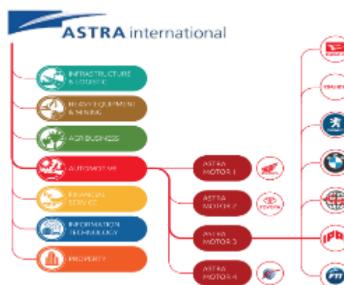
Gambar 2.1 Group Astra.

PT Inti Pantja Press Industri adalah anak Perusahaan dari PT Astra International Tbk yang tergabung dalam group otomotif Astra Motor 3. PT Inti Pantja Press Industri merupakan perusahaan Joint Venture , Dimana Shareholders PT Astra International sebesar 89.36% dan Marubeni Itochu Steel sebesar 10.6%.