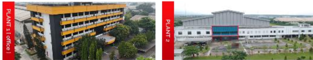
Gambar 2.2 Pabrik PT IPPI.

Kaliabang no 1 Pondok Ungu, Bekasi, Jawa Barat, dan Pabrik Karawang berada di Kawasan Industri Surya Cipta, Karawang Timur, Jawa Barat.