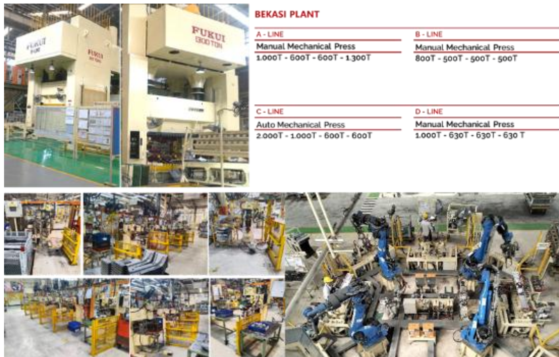
Gambar 2.5 Fasilitas proses produksi Plant Bekasi.

Dalam menjalankan bisnis PT Inti Pantja Press Industri didukung beberapa fasilitas untuk menunjang proses produksi dan lainnya. Plant Bekasi memiliki proses produksi 4 Line Stamping dan 14 Line Welding dan penunjang fasilitas proses produksi terdapat mesin trial, mesin spotting, mesin machining dan 3D CAD.