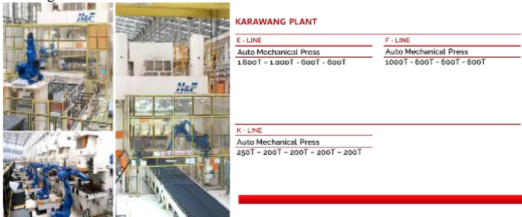
Gambar 2.6 Fasilitas proses produksi Plant Karawang.

Plant Karawang memiliki fasilitas proses produksi 3 line stamping dan 1 line welding.