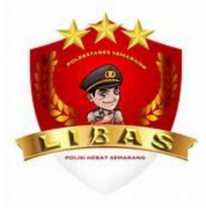
Gambar 2.5 Logo LIBAS