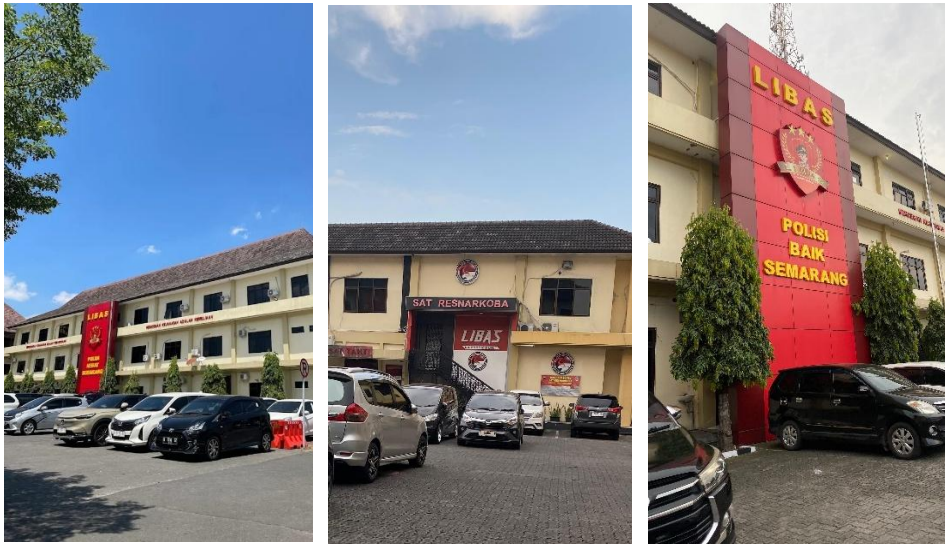
Gambar 2.3 Polrestabes Kota Semarang

menggantikan Kombes. Pol. Irwan Anwar, S.I.K., S.H., M.Hum yang menjabat dari tahun 2020-2024. Polrestabes Semarang merupakan bagian Kepolisian Republik Indonesia di lingkup Kota Semarang dengan jumlah personelnnya sebanyak 2.974 personil