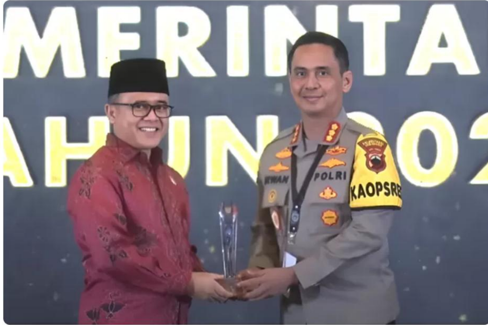
Gambar 2.7 Dokumentasi Polrestabes saat mendapatkan Penghargaan Top Inovasi Pelayanan Publik