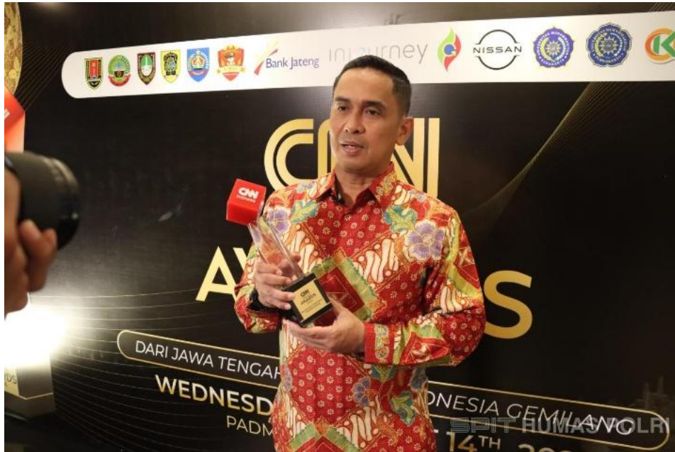
Gambar 2.6 Dokumentasi Polrestabes saat mendapatkan Penghargaan Best Innovation In Public Service