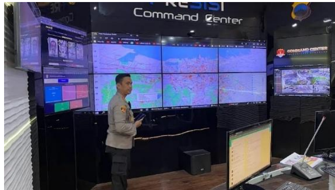
Gambar 2.9 Presisi Command Center (PCC) di Polrestabes Kota Semarang