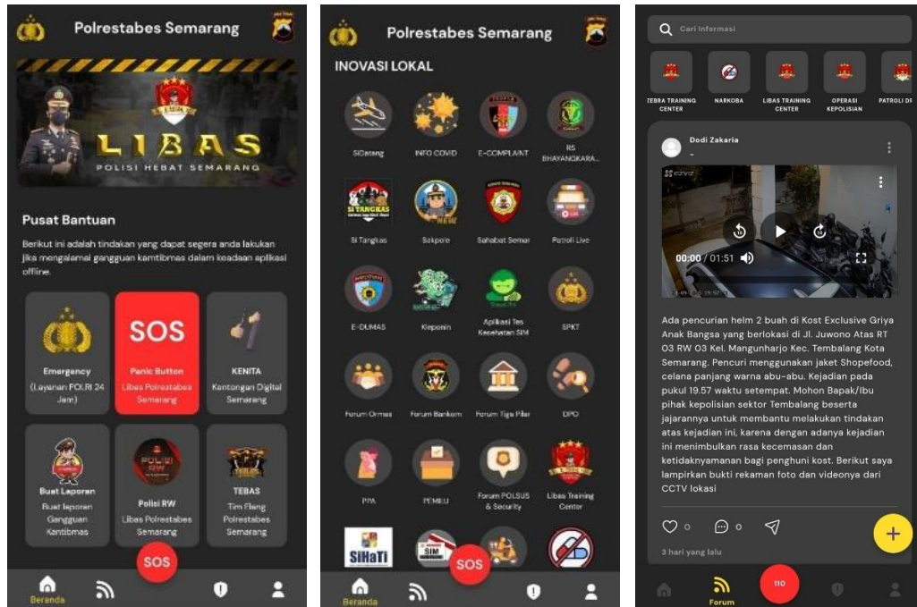
Gambar 2.8 Fitur-Fitur LIBAS