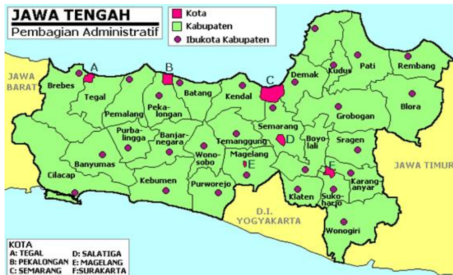
Gambar 2.1 Peta Provinsi Jawa Tengah

Provinsi Jawa Tengah mempunyai luas wilayah 32.548 km 2 . Luas ini hanya sekitar 1,7% dari total luas Pulau Jawa yang merupakan kurang lebih 25% dari totalnya. Sekitar 992.000 hektar, atau 30% dari pemanfaatan wilayah ini, adalah lahan pertanian, seperti sawah. Sekitar 2.260.000 hektar, atau 69% dari pemanfaatan lainnya, adalah lahan non-agrikultur.