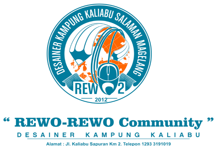
Gambar 4.6: Logo Komunitas Rewo-Rewo

Bar yang merupakan salah satu pelopor pendiri komunitas. Makna-makna filosofis juga disertakan pada setiap komponen-komponen gambar logo tersebut. Gambar bola dunia berwarna jingga di dalam logo yang dikelilingi oleh gambar pensil dan mouse bermakna bahwa produk yang dipasarkan oleh anggota-anggota komunitas merupakan produk yang menglobal atau mencakup seluruh wilayah di dunia. Produk logo hasil dari kegiatan desain grafis tidak hanya dapat dipasarkan secara offline melainkan juga online yang disarankan oleh website-website outsourcing . Dengan kemudahan berkomunikasi secara online , maka kegiatan berbisnis pun tidak lagi dibatasi pada wilayah tertentu saja. Begitu pula dengan para anggota komunitas yang dalam penjualan produk-produk logonya telah mencapai ke wilayah Amerika, India, dan juga beberapa wilayah di Asia.