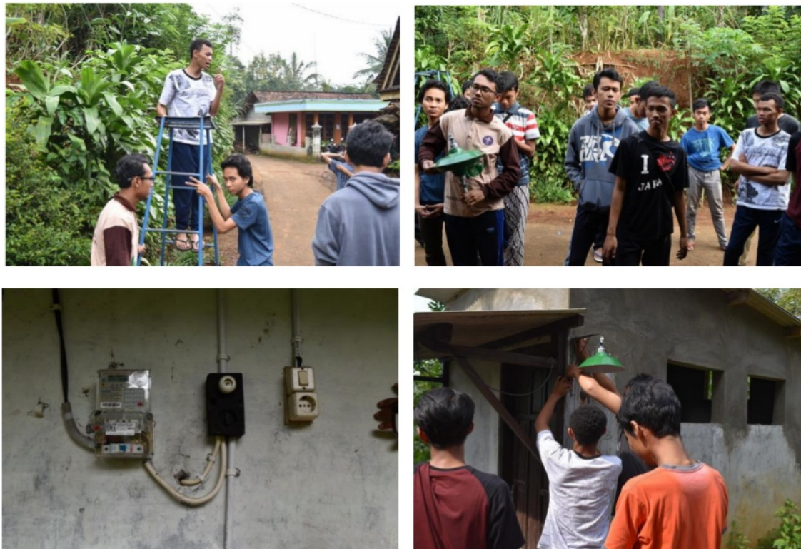
Gambar 3. Foto-foto kegiatan pengabdian masyarakat