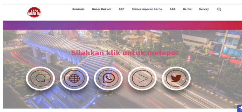
Gambar 1.2 Beranda Website Lapor

Sapa Mbak Ita merupakan lanjutan kebijakan dari wali kota sebelumnya yaitu “Lapor Hendi”. Lapor Hendi masuk 10 besar sarana aduan masyarakat terbaik pada bulan Desember 2019 yang diadakan oleh Kompetisi Lapor SP4N. Berdasarkan Survey Laporan Tahunan Lapor Hendi yang diperoleh dari Dinas Kominfo Kota Semarang periode 2021, terdapat 7 unsur pelayanan pengaduan yang telah menunjukkan hasil kinerja baik. Di antaranya adalah Persyaratan dengan nilai 82,52; Sistem, mekanisme, prosedur pelayanan dengan nilai 81,99; Biaya layanan dengan nilai 76,81; Spesifikasi atau Fitur dengan nilai 81,56; Perilaku petugas dengan nilai 81,11; Penanganan pengaduan saran, dan masukan dengan nilai 78,36 serta Sarana Prasarana dengan nilai 78,29. Disamping itu, masih terdapat unsur pelayanan yang kinerjanya masih kurang baik antara lain: waktu pelayanan dengan nilai 76,08 dan kompetensi petugas dengan nilai 76,08. Secara keseluruhan nilai kualitas pelayanan adalah 79,228 dengan mutu layanan berakreditasi (Laporan Indeks kepuasan Masyarakat Layanan Pengaduan Publik Lapor Hendi Tahun 2021)