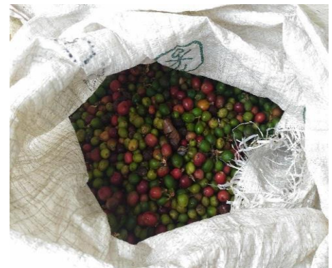
Hasil Panen Kopi