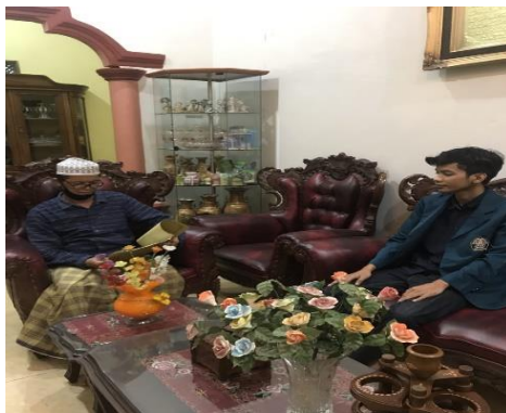
Diskusi dan meminta Izin dengan kepala Desa