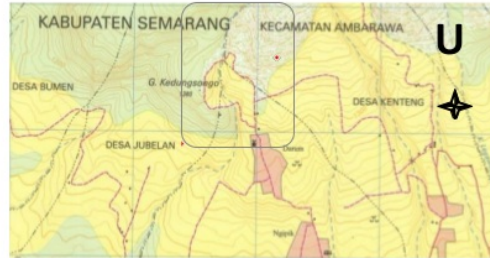
Gambar 1. Peta daerah pengukuran suhu permukaan dangkal dan spontaneous-potensial, tanda ● adalah titik pengukuran [8].

Penelitian dilakukan di kawasan manifestasi panasbumi di Gedhongsongo, sisi Selatan Gunung Ungaran Semarang, Jawa Tengah, seperti diberikan pada Gambar 1. berikut.