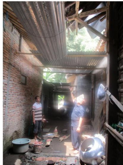
(b) Atap setelah perbaikan