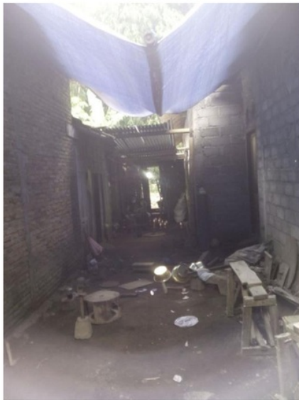
(a) Atap sebelum perbaikan

Perbaikan atap di unit produksi dilakukan semi permanen dengan menggunakan tiang kayu dan bambu serta beratap zeng. Atap bangunan di unit produksi pada awalnya merupakan terpal plastik yang dipasang untuk melindungi panas di musim kemarau dan air di musim hujan. Pengamatan di lapangan menunjukkan lokasi unit produksi merupakan ruang antar bangunan rumah antara rumah bpk Muzazen dengan orang tua Muzazen di tunjukkan di gambar 3. Tiang kayu dan bambu ditanam di sisi dinding antar rumah. Atap seng rumah diatur bertingkat dengan mengarahkan aliran air ke depan. Atap seng juga dibuat model bertingkat untuk menjaga sirkulasi udara dan mengurangi kondisi panas. Dan untuk bagian depan dipasang atap seng yang berfungsi penampung air atau talang. Hasil perbaikan atap rumah di unit produksi ditunjukkan di gambar 3b.