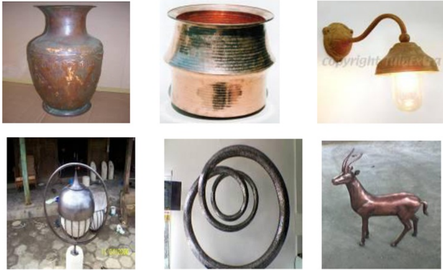
Gambar 1. Produk ukir tembaga dan kuningan berprofil lengkung

Proses pengerjaan produk dengan profil lekukan dan ukuran besar secara umum dikerjakan melalui beberapa tahap meliputi pengemalan, pemotongan, pembentukan (pengerolan, pengelasan) dan penyelesaian akhir. Pengerolan merupakan proses pengerjaan bahan yang diarahkan pada pengurangan ketebalan yang disertai dengan peningkatan kekuatan akibat regangan yang diterima selama pengerolan (Brown, 1998; Groover, 1996). Adanya penurunan ketebalan, bahan akan lebih mudah dibentuk ke profil yang diinginkan (Juvinal 1967). Jenis-jenis ornamen di permukaan bahan juga dapat dimunculkan secara paksa melalui proses pengerolan. Bentuk permukaan rol silinder akan mempengaruhi permukaan bahan yang dikenai proses pengerolan.