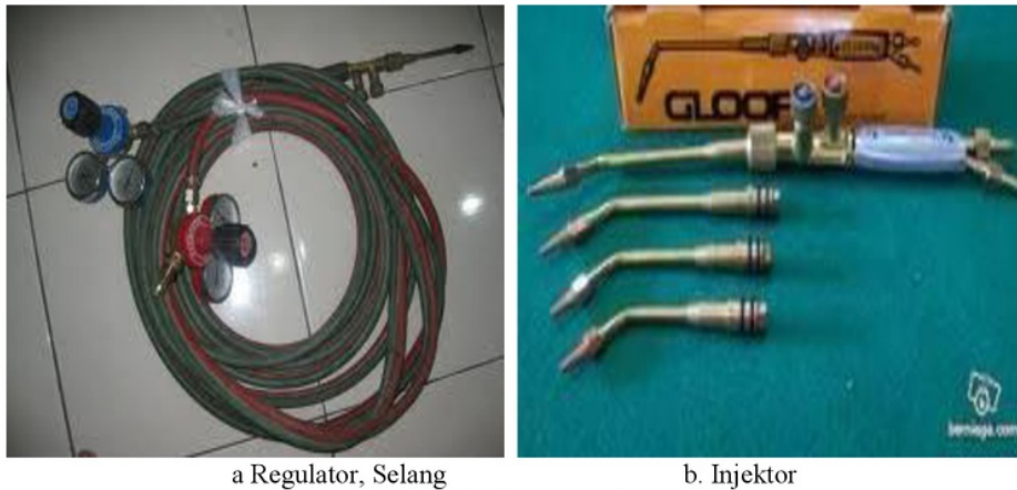
Gambar 4. Komponen las asetilin

Instalasi las asetilin secara umum terdiri dari tabung oksigen dan katup pengaturan, tabung asetilin dan katup pengaturan, selangan distribusi gas, alat ukur tekanan dan injektor nyala las. Pengelasan dengan gas asetilin banyak digunakan di industri ukir kuningan, tembaga dan aluminium. Pengelasan asetilin merupakan pengerjaan multifungsi yakni pemanasan, pemotongan, penyambungan dan finishing. Dalam praktek pengelasan sehari-hari di industri tembaga dan kuningan, instalasi las asetilin dimodifikasi dengan mengganti tabung asetilin dengan tabung gas LPG. Ada beberapa pertimbangan industri atau Zazen Art Galeri menggunakan gas LPG meliputi harga murah Rp 5.400 per kg untuk tabung 3 kg di tahun 2016, tersedia secara luas, distributor gas dekat dan kemampuan pengelasan untuk proses pemanasan, pemotongan dan penyambungan seperti las asetilin. Dalam pengamatan dan analisa pengelasan di industri, bahan tembaga dan atau kuningan mampu dipotong dan disambung secara sempurna dengan las LPG.