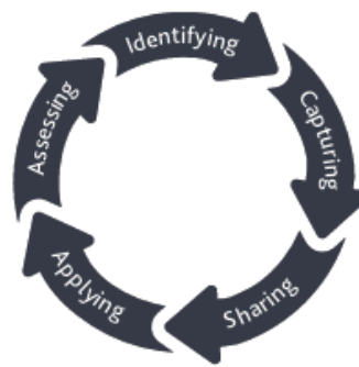
The knowledge transfer life cycle