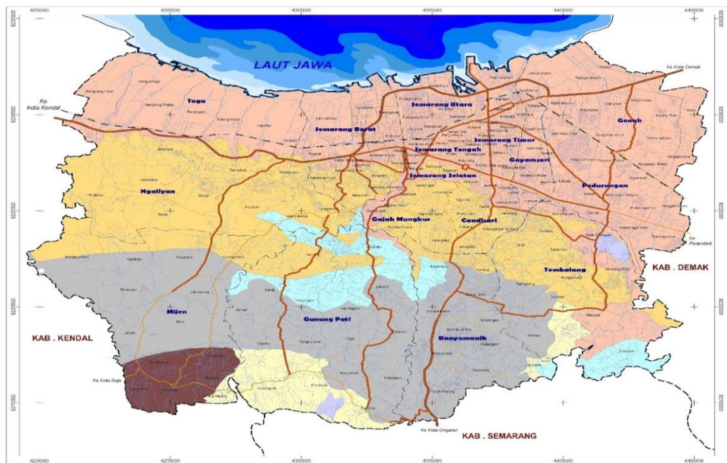
Gambar 2.1 Peta Kota Semarang

Kota Semarang merupakan salah satu Kota di Jawa Tengah yang berdiri sejak tanggal 2 Mei 1547 dan merupakan Ibu Kota Provinsi Jawa Tengah. Sebagai Kota Pusat Pemerintahan Provinsi Jawa Tengah, Kota Semarang memiliki luas wilayah sebesar 373,70 km 2 yang lokasinya berbatasan langsung dengan Kabupaten Kendal di sebelah barat, Kabupaten Semarang di sebelah selatan, Kabupaten Demak di sebelah timur dan Laut Jawa di sebelah utara dengan panjang garis pantai berkisar 13,6 km. Kondisi geografis kota Semarang dapat dilihat pada gambar 2.1 dibawah ini :