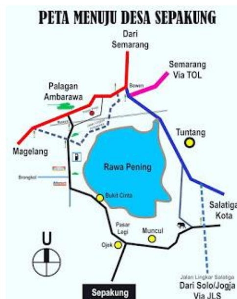
Gambar 2.2. Peta Menuju Desa Wisata Sepakung

Desa Wisata Sepakung terletak di kaki pegunungan Telomoyo, Kecamatan Banyubiru, Kabupaten Semarang.