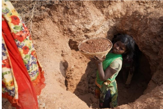
Gambar 2.6 Pekerja anak perempuan sedang megumpulkan mika