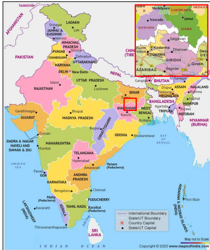
Gambar 2.2 Peta Negara India (Kotak Merah Menunjukkan Letak Pusat Daerah Pertambangan Mika dengan Kasus Pekerja Anak Berada)