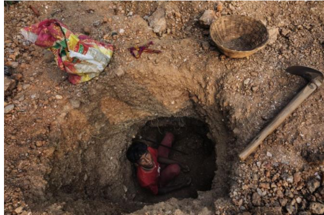
Gambar 2.5 Anak laki-laki sedang menggali dan mengumpulkan mika