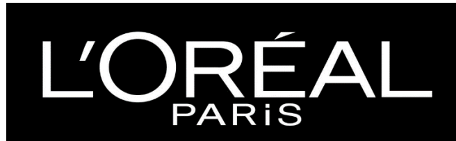
Gambar 2.3 Logo Perusahaan L'Oréal