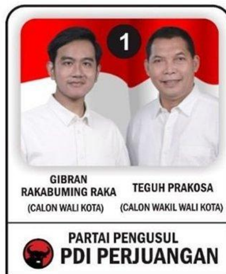
Gambar 2.2 Pasangan Calon Gibran-Teguh