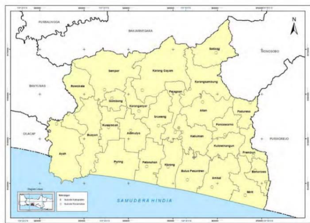
Peta Administrasi Kabupaten Kebumen