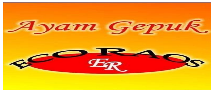
Gambar 1: Logo Ayam Gepuk Eco Raos