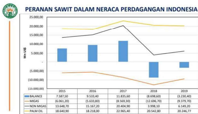
Gambar 1. 1 Peranan sawit dalam neraca perdagangan Indonesia

Industri ini mampu meningkatkan pembangunan daerah pinggiran/ pelosok menjadi pusat pertumbuhan ekonomi di pedesaan. Peran strategis industri minyak sawit mampu mengurangi kemiskinan, mengatasi pengangguran, meningkatkan pendapatan, stabilitas dan menyehatkan neraca pembayaran, kemandirian energi dan lainnya. Perkembangan industri minyak sawit memiliki peluang besar untuk menyejahterakan kehidupan petani (GAPKI, 2019).