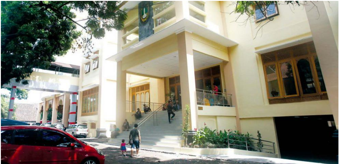
Gambar 2.2 Dispendukcapil Kota Surakarta