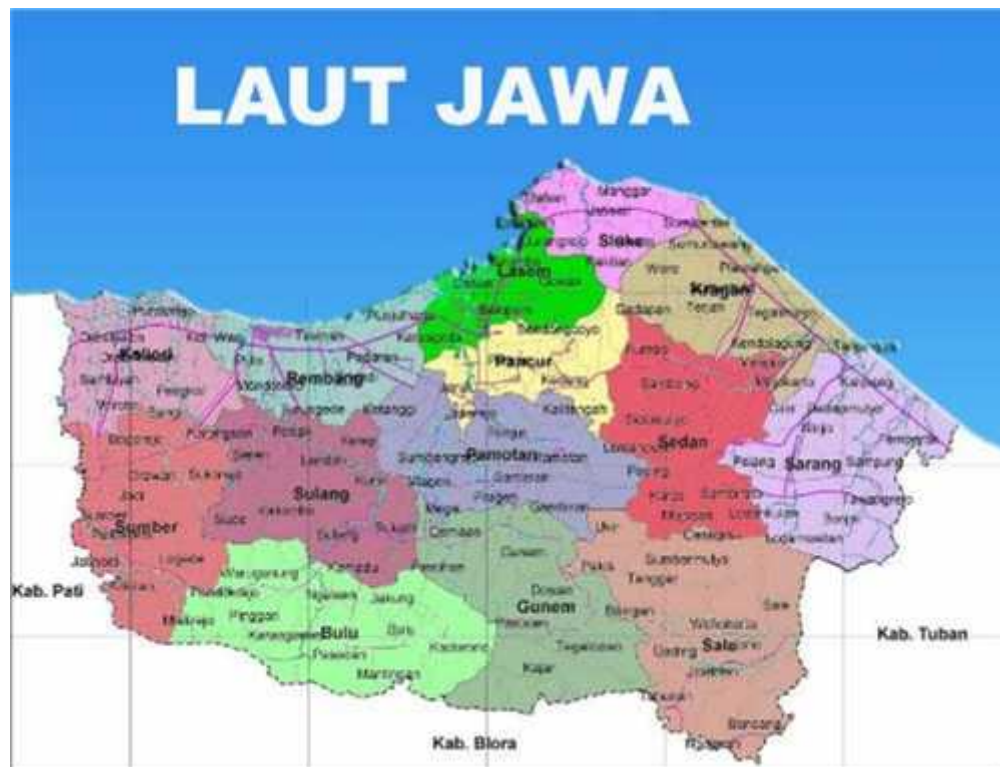
Gambar 2.1 Peta Administrasi Kab. Rembang