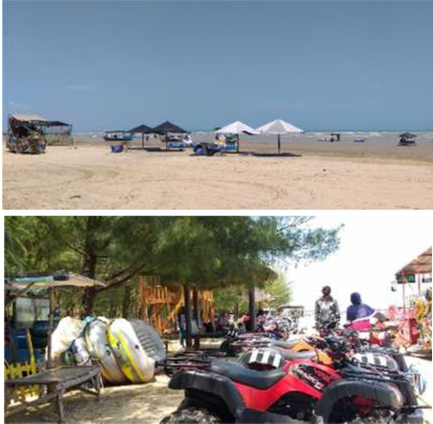
Gambar 2.3 Pantai Karang Jahe