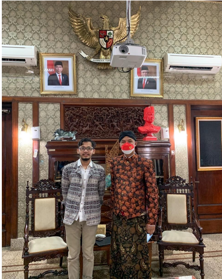
Wawancara Peneliti dengan Gubernur Jawa Tengah Ganjar Pranowo