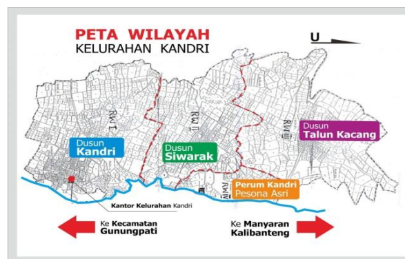
Gambar 2. 1 Peta Wilayah Kelurahan Kandri

Berikut ini adalah gambar peta wilayah Kelurahan Wisata Kandri :