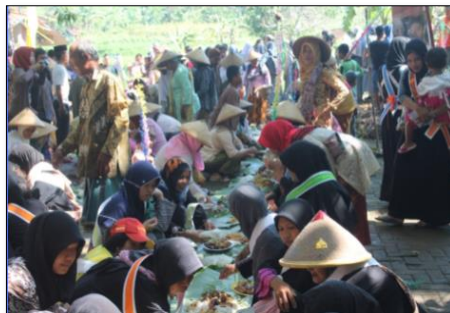
Gambar 2. 2 Nyadran Kali atau Sendang

Proses Nyadran tersebut diselenggarakan dengan penuh kearifan lokal serta tradisi yang masih sangat kental dengan dilengkapi adanya kirab dengan menyuguhkan banyak hal seperti kepala kerbau, gong, dan beberapa makanan tradisional serta terdapat proses makan bersama di sekitar sendang tersebut. Selama berada di sendang juga telah dihimbau adanya berbagai larangan yang tidak boleh dilanggar dan setiap pengunjung yang datang kesana hendaknya tetap mengedepankan nilai sopan santun atau tata krama. Berikut adalah suasana saat pelaksanaan kegiatan Nyadran Sendang :