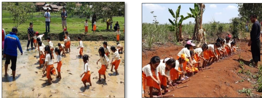
Gambar 2. 3 Kegiatan Edukasi Pertanian

Melalui program edukasi pertanian tersebut merupakan bentuk pelaksanaan pariwisata yang berkelanjutan. Adanya aktivitas wisata tersebut juga dapat dikatakan demikian , karena pemberian edukasi juga bersifat untuk melestarikan kebudayaan pertanian Indonesia sehingga terselip nilai yang masih menjunjung tinggi yaitu nilai kearifan lokal di wilayah tersebut. Berikut adalah suasana kegiatan edukasi pertanian di Desa Wisata Kandri :