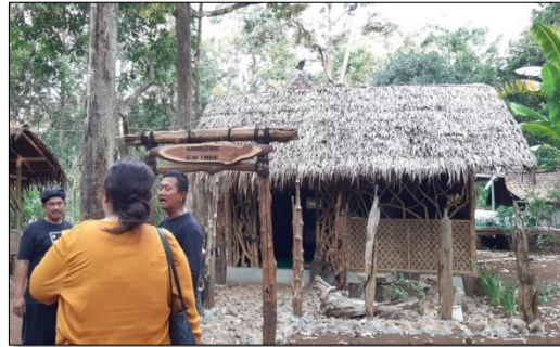
Gambar 2. 4 Omah Alas

taradisional, pembuatan produk-produk kerajinan, drama pertunjukkan sering dilakukan di tempat tersebut. Kondisi Omah Alas dapat kita lihat sebagai berikut :